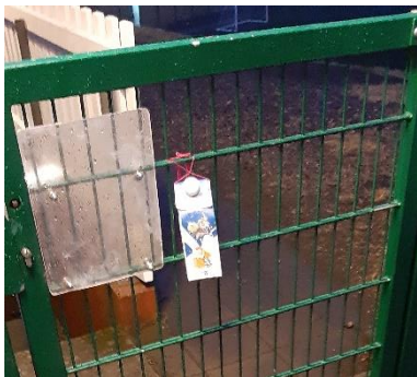
Fyrsta vísbending var á hliðinu

Tveir eldri hóparnir fengu bréf frá jólasveinunum Stúfi og Hurðaskelli þar sem þeir útskýra af hverju þeir geta ekki komið í leikskólann. Þeir segja frá samskiptum sínum við mömmu sína og nefna heimkynni sín Snæfell. Þeir biðja krakkana að fara með sér í ratleik því gjafirnar sem þeir ætluðu að gefa á Hádegishöfða séu í nágrenni leikskólans og af þeim verði krakkarnir að leita. Haldið var af stað með elsta hópinn sem rakti sig áfram með því að finna vísbendingar frá 1-5 í okkar nær samfélagi niður að Verndarsvæði. Verndarsvæðið er sameiginlegt útvistarsvæði skólanna í Fellabæ. Þriggja og fjögurra ára krakkarnir fóru niður á stíg á skógarsvæði sem liggur samsíða Lagarfljóttinu.